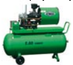
Albert E.80 Vario - úsporný šroubový kompresor