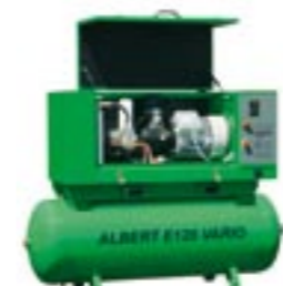
Albert E.120 Vario - úsporný šroubový kompresor